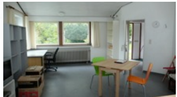
Wohn- und Arbeitsraum im Atelier Nummer Drei. Das Fenster zeigt nach Osten