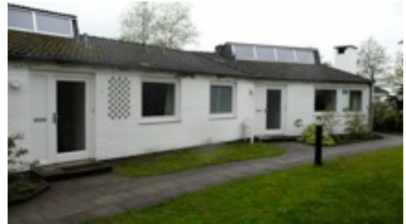
Die Ateliers Eins, Zwei und Drei aus östlicher Richtung.