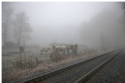
Pferdeweiden mit Schienen des Museums-Moorexpress.