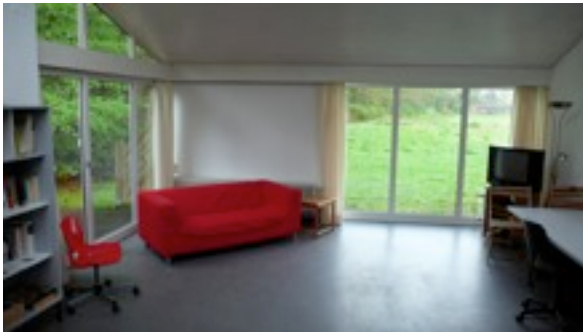
Der große Wohn- und Arbeitsraum des Atelier Nummer Eins.