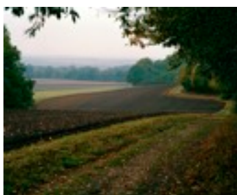
Blick vom Weyerberg