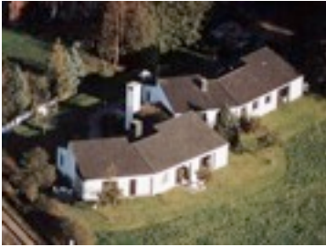
Die fünf Martin Kausche Ateliers, aus westlicher Richtung gesehen.