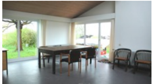
Der Arbeitsraum im Atelier Nummer Fünf mit Blick auf die Pferdeweiden..