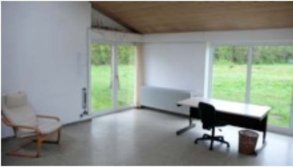
Arbeitsraum Atelier Nummer Vier. Das große Fenster zeigt nach Westen.