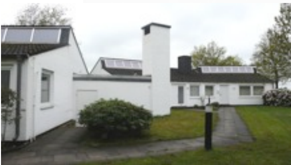
Die Ateliers Nummer Vier und Fünf aus östlicher Richtung gesehen.